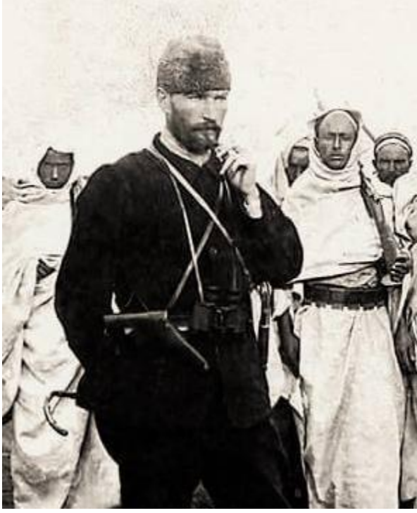
Fotoğraf: Derne Komutanı Kurmay Binbaşı Mustafa Kemal - Trablusgarp, 1911

“Benden sonra gelenler acaba böyle bir ruhla çalıştığımı fark edecekler mi?” diye bile düşünmemelidir. Hatta en mesut olanlar, hizmetlerinin bütün nesillerce meçhul kalmasını tercih edecek karakterde bulunanlardır. Makul bir adam, ancak bu suretle hareket edebilir. Hayatta tam zevk ve saadet ancak gelecek nesillerin şerefi, varlığı, saadeti için çalışmakta bulunabilir. 1